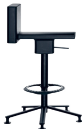
Matt colour Black 1764 C