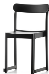
Black lacquered beech Pyökki, maalattu musta ビーチ材 ブラック ラッカー