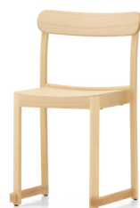
Natural lacquered beech Pyökki, lakattu luonnonvärinen ビーチ材 ナチュラル ラッカー