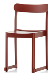
Dark red lacquered beech Pyökki, maalattu tummanpunainen ビーチ材 ダークレッド ラッカー