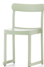
Green lacquered beech Pyökki, maalattu vihreä ビーチ材 グリーン ラッカー