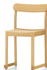
Natural lacquered oak Tammi, lakattu luonnonvärinen オーク材 ナチュラル ラッカー