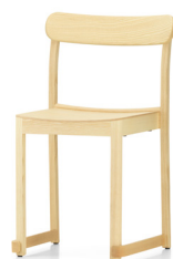
Natural lacquered ash Saarni, lakattu luonnonvärinen アッシュ材 ナチュラル ラッカー