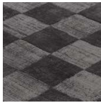
PHANTOM ID 3180