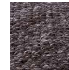
CHARCOAL ID 1453