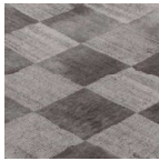
MAGNET ID 3181