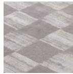
WET WEATHER ID 3182