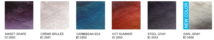
ID 2654 / REFINERY / STEEL GRAY