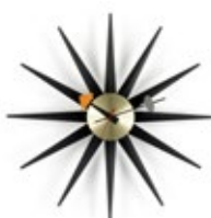
Sunburst Clock, zwart/messing, Ø 470