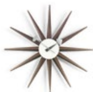
Sunburst Clock, notenhout, Ø 470