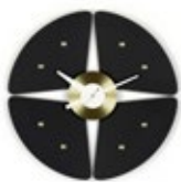
Petal Clock, zwart/messing, Ø 448