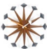
Polygon Clock, notenhout, Ø 430