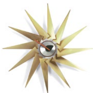
Turbine Clock, messing/aluminium, Ø 765