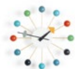
Ball Clock, multicolor, Ø 330