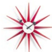
Sunburst Clock, rood, Ø 470