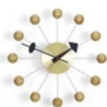
Ball Clock, kersenhout, Ø 330