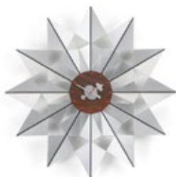
Flock of Butterflies, aluminium, Ø 610