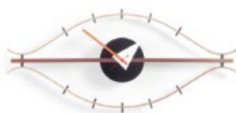
Eye Clock, messing/walnoot, H 340 x B 760