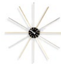
Star Clock, chrom/messing, Ø 610